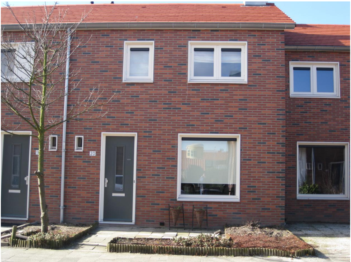
Een voorbeeld van één van de gerenoveerde woningen.

De technische installaties zijn recent gekeurd; een keuringscertificaat is afgegeven.